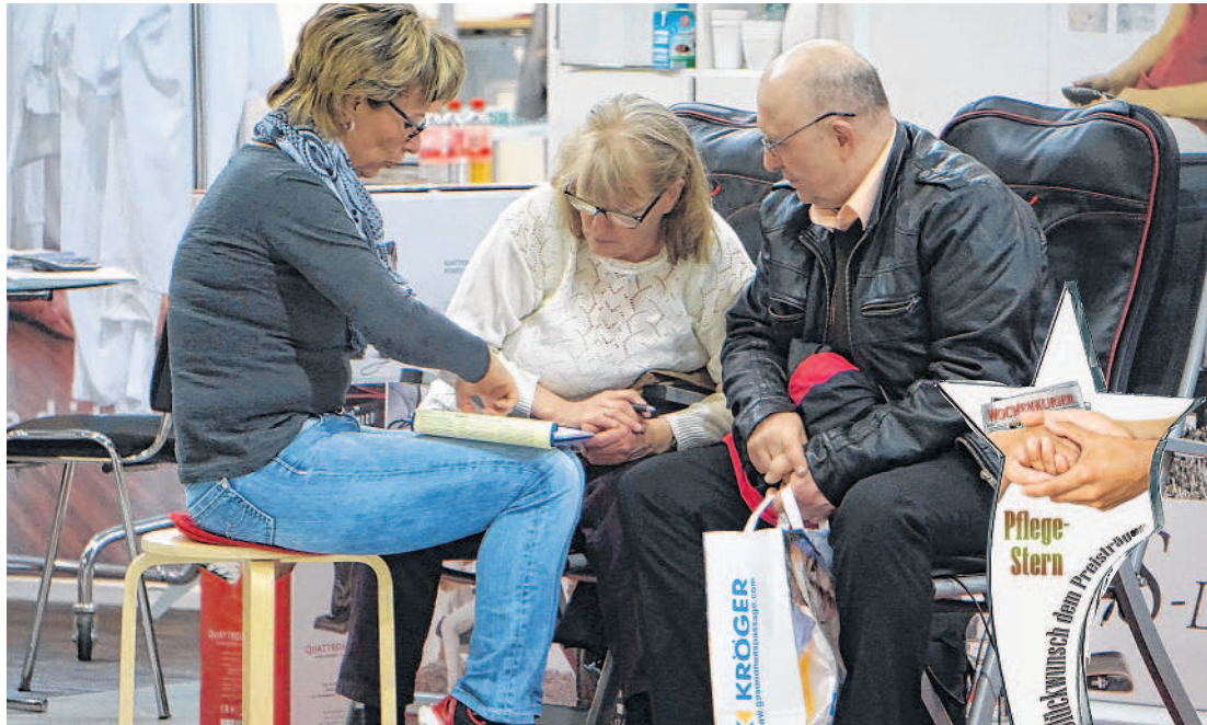
Zahlreiche Informationen rund um das Thema Pflege und Gelegenheit für Fachgespräche bietet die zweite Messe »Zukunft Pflege«. Erstmals wird in diesem Jahr der Pflegeestern für engagierte Pflegekräfte verliehen.

Was wäre eine Messe ohne Unterhaltung? Genau dafür sorgt das »Duo Herzblatt« mit einer Mischung aus fetziger Volksmusik und Ohrwurmschlagern. Außerdem präsentieren »Die 4 Capriolen« Schlager und Chansons. Außerdem locken die über 60 Aussteller mit diversen Mitmachan-